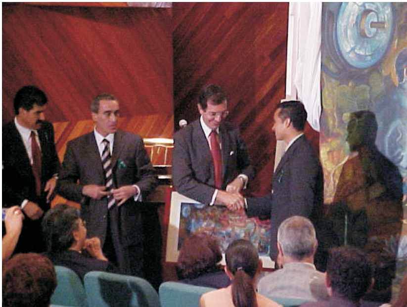
El Dr. Jaime Supúlveda Amor, Coordinador General de los Institutos Nacionales de Salud recibe de manos del joven pintor José de Jesús Camacho una reproducción enmarcada del mural develado.

Con el fin de recabar donativos para la realización de trasplantes, se realizó una campaña entre Movimiento Azteca y la Fundación Nacional de Trasplantes (FUNAT), con la cual se reunieron 10 millones 204 mil pesos con los que se apoyará la realización de trasplantes de córnea a 612 personas. Los fondos fueron entregados a FUNAT. La misma empresa televisiva distribuyó 1 millón 500 mil tarjetas de donador de órganos y tejidos.