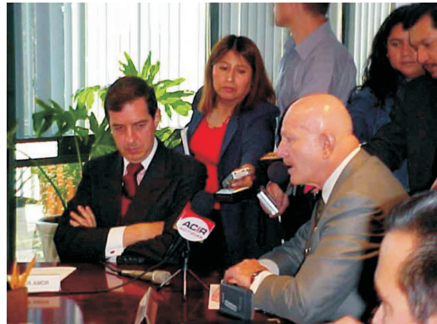
Intervención de diversos funcionarios de la S.S.P. Del G. D.F. durante la firma del convenio con el CENATRA.