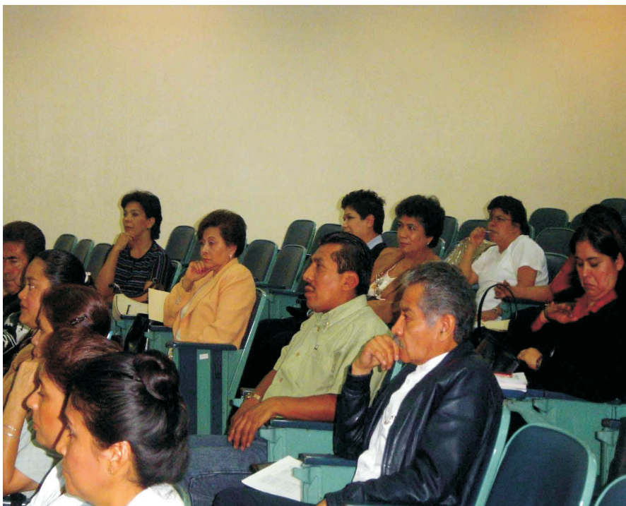
El CENATRA organizó cursos para la formación de líderes promotores de la donación y trasplante de órganos. Estos cursos se vieron atendidos por los integrantes de diferentes organizaciones no gubernamentales.

Conferencias y cursos. Se realizaron conferencias, simposios y cursos sobre el proceso de donación y trasplantes en diferentes hospitales e instituciones a lo largo y ancho del país. Estos cursos estuvieron dirigidos a la comunidad médica, enfermeras, agentes de ministerios públicos, estudiantes universitarios y al público en general.