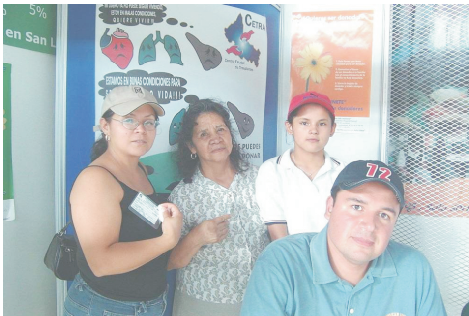
El contacto directo con la población interesada en el programa de Donación y Trasplante de Órganos permitió fortalecer la confianza del público en general

Módulos de información y promoción. Además de los que atienden de manera permanente, durante la Semana Nacional de Donación y Trasplante se colocaron módulos en plazas públicas, hospitales, universidades, iglesias, entre otros sitios. Asimismo se aprovecharon eventos festivos de las localidades para instalar mesas informativas.