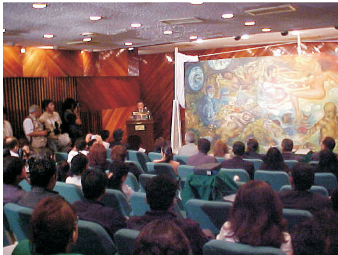
Ceremonia de develación del mural "Un regalo de vida: realidad y esperanza para el mañana".