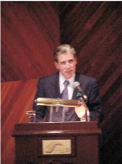
Participación del Dr. Julio Frenk Mora, Secretario de Salud durante la rueda de prensa celebrada en el auditorio "Miguel E. Bustamante".