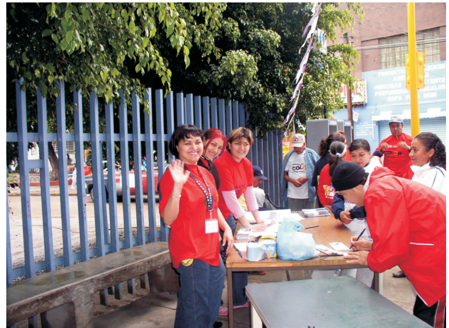
Mesa de información pública en el estado de Guanajuato, para la credencialización como donador de órganos.

Se realizaron eventos especiales con la participación de los gobernadores y secretarios de salud de diferentes estados de la República en donde se expresó el apoyo de las autoridades del más alto nivel en la entidad, al Programa de Donación y Trasplante de Órganos y Tejidos. Así por ejemplo, en los estados de Jalisco, Guerrero, Guanajuato, Colima, Aguascalientes, Chiapas, se contó con la presencia y el apoyo total de diferentes gobernadores y autoridades.