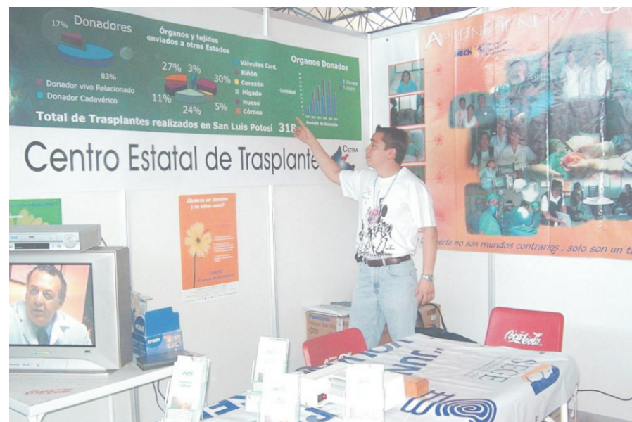
En el estado de San Luis Potosí, la actividad del Centro Estatal de Trasplantes fue muy destacada y valiosa.