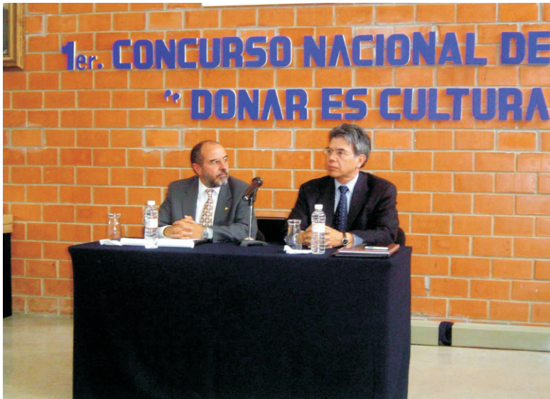
Después de la firma del convenio se ofreció una conferencia de prensa, en las instalaciones de la Universidad La Salle Pachuca.

En este rubro vale la pena destacar la gestión realizada por el COETRA del Estado de México con la universidad de ese estado, para la implementación de un diplomado en trasplantes, así como la creación de una materia optativa sobre trasplantes, en la Facultad de Medicina.