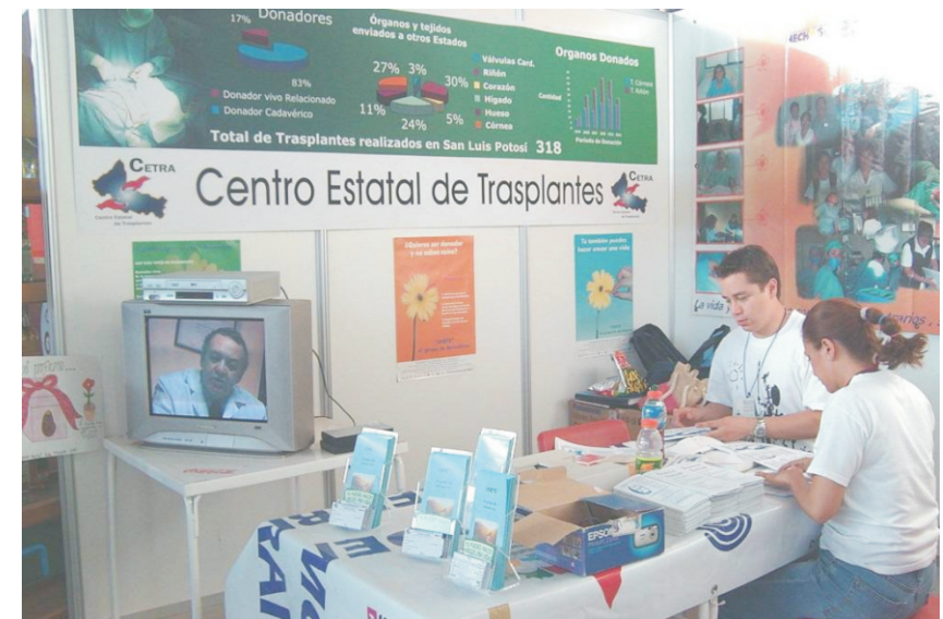
Se utilizaron todo tipo de medios para hacer llegar la información a la población interesada.

En estos espacios se informó a la población sobre el proceso de donación y trasplantes y se promovió la entrega de tarjetas de donador. Se instalaron módulos de donación en los siguientes Estados de la República: San Luis Potosí, Guerrero, Guanajuato, Colima, Chihuahua, Chiapas, Zacatecas, Guanajuato, Estado de México, Jalisco.