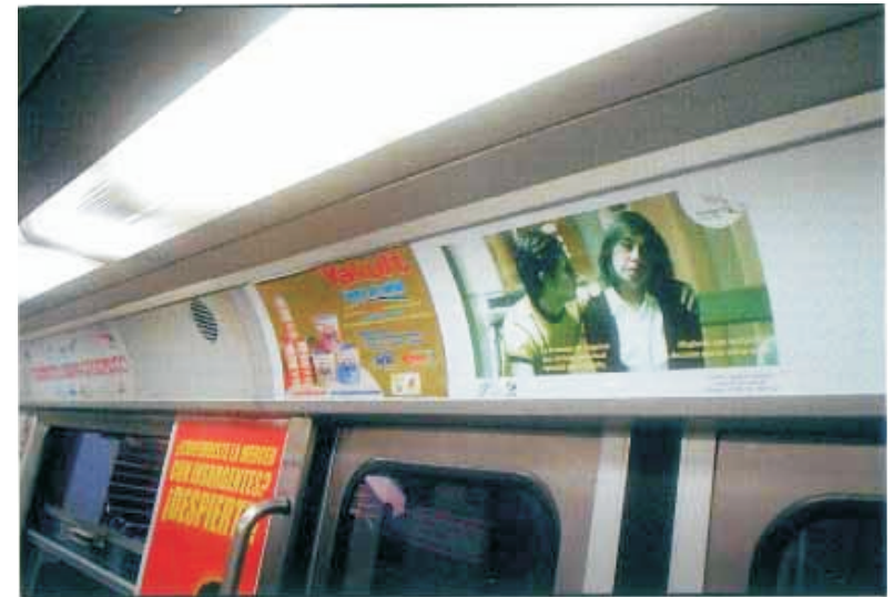
Diferentes carteles transmitieron el mensaje de la campaña 2004.

METROREY, que es el sistema de transporte colectivo en la ciudad de Monterrey, Nuevo León, cedió generosamente espacios para carteles que fueron utilizados por el COETRA de esa entidad federativa.