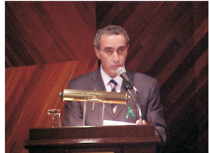
Dr. Arturo Dib Kuri, Informó sobre los logros alcanzados en materia de trasplantes durante la gestión administrativa actual.

Ruedas de prensa. Se convocó en el D. F. y en otras entidades federativas (Guanajuato, Chihuahua y Jalisco) a periodistas de radio, televisión y prensa de medios nacionales y estatales para informar sobre el inicio de las actividades de la Semana Nacional de Donación y Trasplante de Órganos y Tejidos 2004.