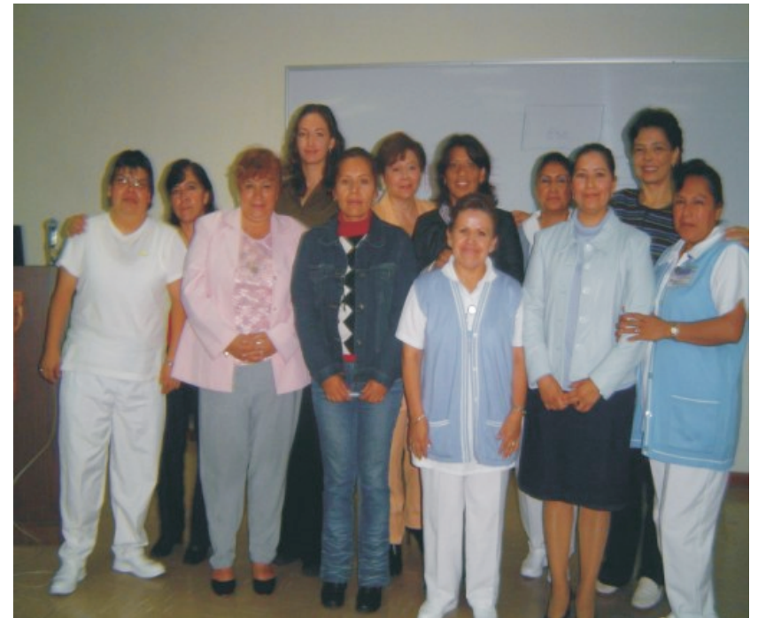
Participantes en un curso dirigido a integrantes de organizaciones no gubernamentales, organizado por el CENATRA para promover la formación de líderes promotores de la donación de órganos.