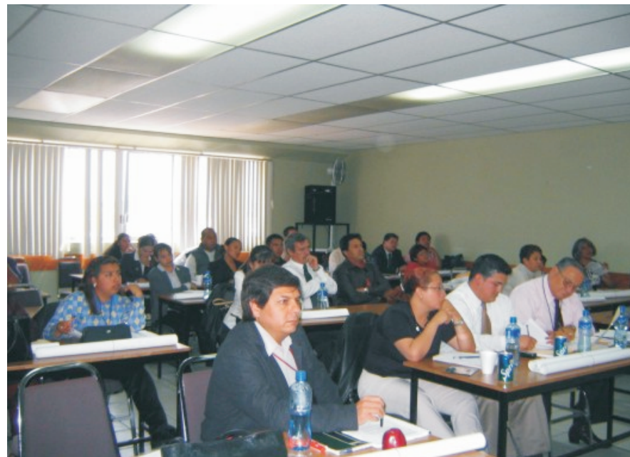
Curso dirigido a agentes de ministerio público en Pachuca, Hidalgo, por parte del CENATRA y el COETRA del mismo estado.