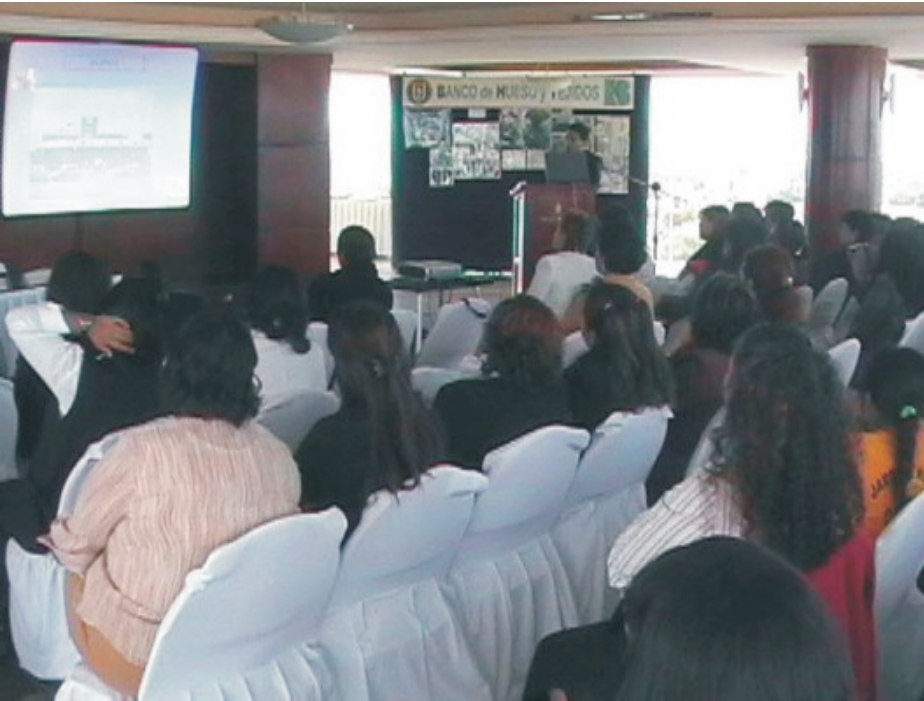
Aspecto de una conferencia realizada en San Luis Potosí

Se abordaron desde temas generales en cuanto al proceso de donación y trasplante, hasta temas especializados en legislación y aspectos terapéuticos. Entre otros, en los siguientes estados se llevaron a cabo eventos académicos de gran trascendencia para la organización del Sistema Nacional de Trasplantes: Aguascalientes, Guanajuato, Chihuahua, Chiapas, Nuevo León, Guanajuato, Estado de México, Jalisco, Zacatecas.