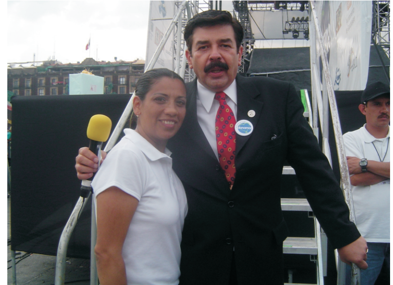
El apoyo de Televisa a través de un grupo de conductores y actores dio un mayor realce al evento organizado en la ciudad de México.

“Donatón” en Chihuahua. Se llevó acabo en la Plaza Mayor, se invitó a varios cantantes locales así como a grupos de baile folclórico y danza moderna para sus presentaciones. Entre los eventos se incluyeron testimonios de pacientes trasplantados y pacientes en lista de espera. Se entregaron 670 tarjetas de donadores enmicadas.