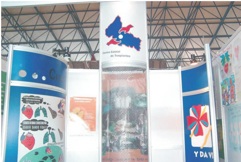
Otro aspecto de la actividad en los módulos de información.

En estos espacios se informó a la población sobre el proceso de donación y trasplantes y se promovió la entrega de tarjetas de donador. Se instalaron módulos de donación en los siguientes Estados de la República: San Luis Potosí, Guerrero, Guanajuato, Colima, Chihuahua, Chiapas, Zacatecas, Guanajuato, Estado de México, Jalisco.