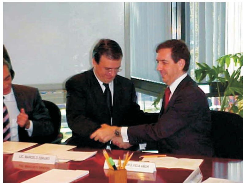
La firma del convenio fue atestiguada por el Dr. Jaime Sepúlveda Amor, Coordinador General de los Institutos Nacionales de Salud.