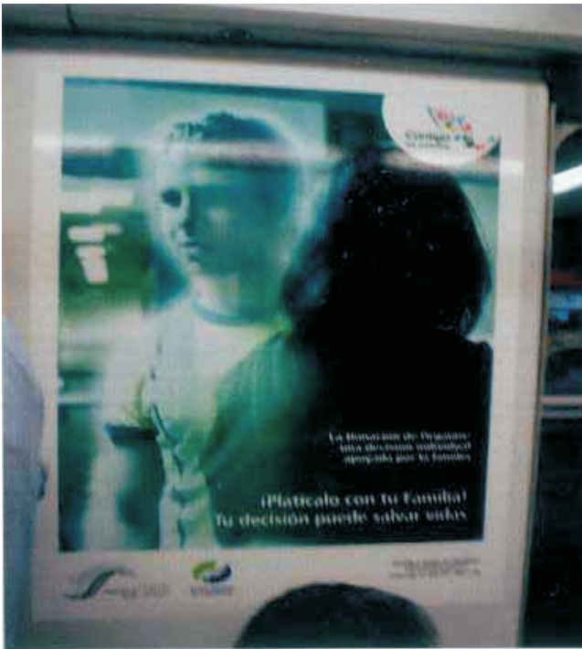
Aspecto de los carteles exhibidos en diferentes espacios del los vagones del Sistema de Transporte Colectivo Metro de la ciudad de México.