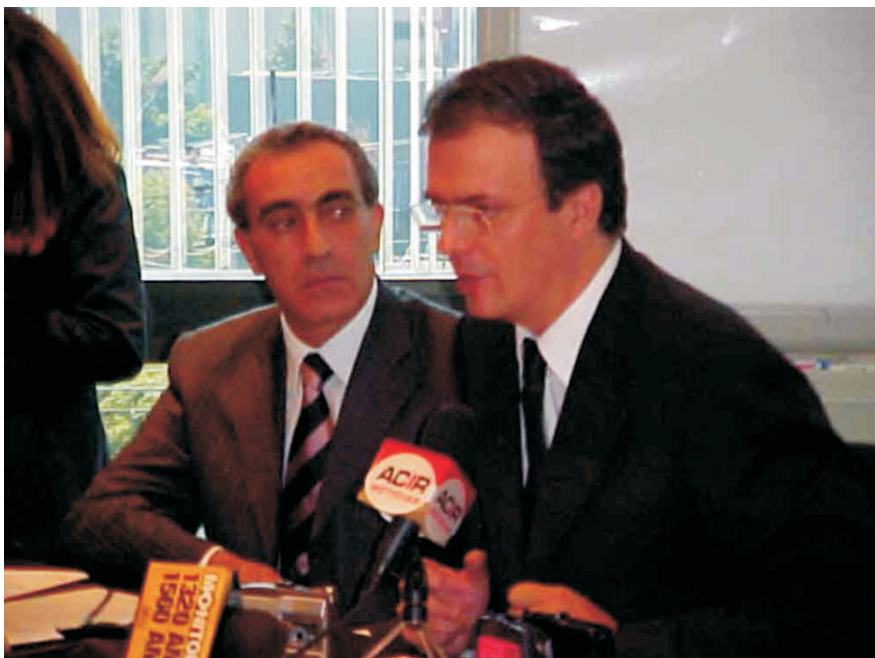
Intervención del Lic. Marcelo Ebrard C. durante la firma del convenio de la S.S.P. del Gobierno del Distrito Federal y el CENATRA.

Convenio entre la Secretaría de Seguridad Pública del Gobierno del Distrito Federal y el CENATRA. En las oficinas de la CGINS para facilitar el transporte de personal médico y paramédico, en actos de procuración de órganos y tejidos en la ciudad de México y estados circunvecinos, a través de sus ambulancias, helicópteros y otros vehículos.