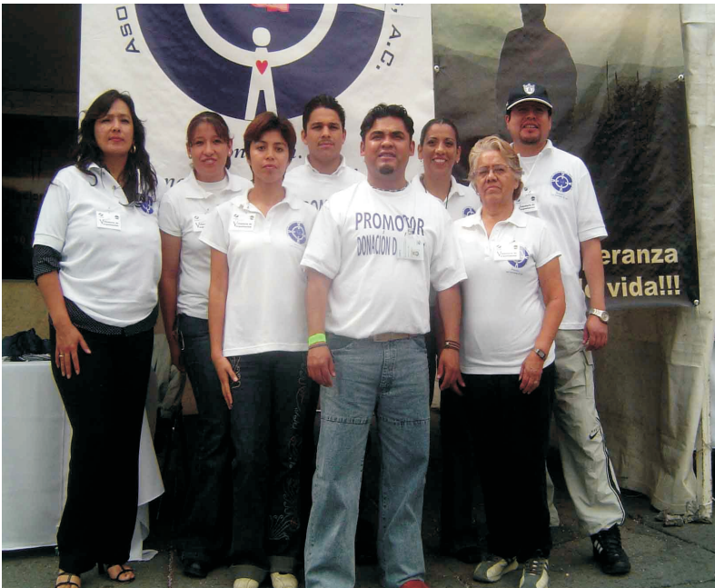
Aspecto de los Promotores de la donación de órganos y tejidos, durante el evento de Donamor en el Zócalo de la ciudad de México.

“Donamor Puebla 2004”. Comprendió una jornada de credencialización de diez horas consecutivas en el zócalo de Puebla. Con el fin de hacer más atractivo el evento, se colocó un escenario en el que participaron un gran número de artistas locales y nacionales.