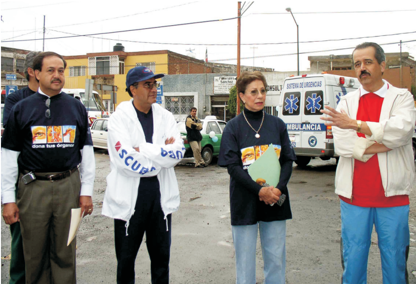
Evento con la participación de autoridades de salud.

Se realizaron eventos especiales con la participación de los gobernadores y secretarios de salud de diferentes estados de la República en donde se expresó el apoyo de las autoridades del más alto nivel en la entidad, al Programa de Donación y Trasplante de Órganos y Tejidos. Así por ejemplo, en los estados de Jalisco, Guerrero, Guanajuato, Colima, Aguascalientes, Chiapas, se contó con la presencia y el apoyo total de diferentes gobernadores y autoridades.