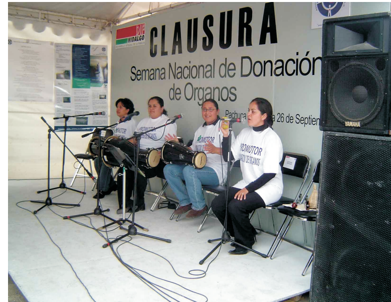
Clausura de la Semana Nacional de Donación y Trasplante de Órganos en Pachuca, Hidalgo.